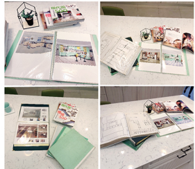
為了將廚具設計帶到位，早出賣品不足，歌哥將國內外設計書籍，並自學電腦繪圖，店內留下的書籍，記錄著彰化歐鄉廚具累積珍貴的成長軌跡。

歌哥對客戶服務的黏貼迅速，更讓人稱道：好幾個除夕夜都是在拉下鐵門，要準備回老家吃團圓飯時，遇到客人煮年夜飯爐子點不著趕到店面求救，工具箱一提就跟著客人回家修產品；印象最深刻的，是有個風雨交加的颱風夜，晚上快12點了客人在洗澡時熱水器壞掉，一通電話打來，他立馬冒著風雨趕到客人家維修，讓客人好生感動！到現在就靠店面搬到了金馬路，這些客人還是一路相隨，成了最忠實的老主顧。