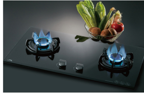
近年來陸續因為消費者好評及指定，店內開始販售喜特麗其他產品，例如，晶瓷爐，就是歌嫂相當看好的明星產品。