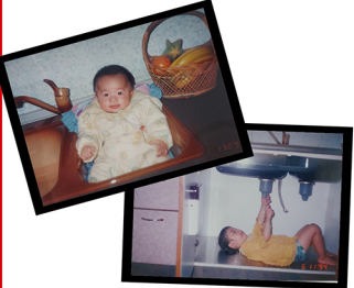
街市幫幫幫，一雙兒女從小就在廚具店長大；水櫃是關兒床(上圖)，還有樓層樓梯安裝維修(下圖)。

剛開始，傳統廚具店開在彰化市民生路上，小小不到十坪的店面，夫婦倆人幾乎全年無休，哪裡能賺錢哪裡去，每日工作超過十四小時，一邊撫育幼子一邊工作，就是希望趕快將負債還清；沒想到，二年不到，不但還光負債，更頂下隔壁店面，生意越做越大；隔年，店面更擴店遷到曉陽路交通要壘，轉型為歐化廚具店。