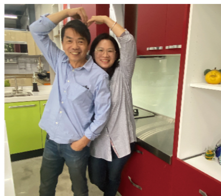
認識結縭近三十年的網哥和網嫂,至今感情仍如膠似漆,相當令人稱羨。網哥說,妻子是他這一輩子,最重要的貴人。

喜特麗,以能與永久這麼努力的夥伴合作為榮! 網哥及網嫂,讓我們一起為永久下一個30年一起努力!