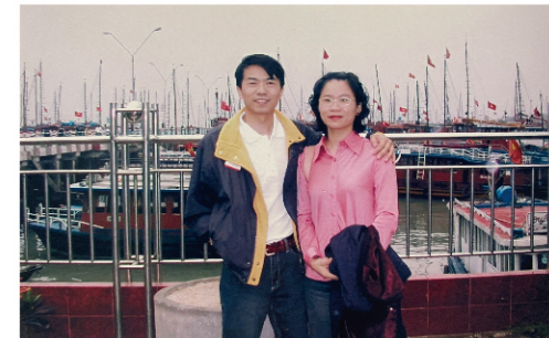
網哥網嫂是喜特麗國內外旅遊的最好拍檔。照片中是當年倆人打拚事業多年後首次的國外(北越)旅遊,當然一定是給了喜特麗。

事業剛起步以及負債數百萬等多重壓力,讓倆人只能不停往前奔跑,無法休喘。唯一的休閒,就是跟著業界在國內輕旅行。網嫂回憶,當年連去個杉林溪,工作電話都接不完,想出去放鬆,壓力卻無法擺脫。直至開業第九年,第一次跟著喜特麗到北越,那次的旅遊他們印象深刻,因為緊繃多年的神經終於稍稍得到紓解,第一次無人叨擾,第一次能夠完全放鬆。網哥說,從北越旅遊開始,才慢慢感覺,逐漸擁有自己的人生、自己的時間。自此,他們開始跟著喜特麗四處走透透,也帶著孩子一起到泰國、北海道,留下難得全家共遊的美好回憶。