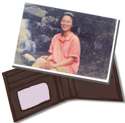
網嫂送給網哥的第一張照片,始終被保存在網哥皮夾內。有次皮夾遺失了,還被貴人拾回。網哥笑稱,愛了這麼多年才娶回的老婆,要好好帶在身上收著看著,不能讓她給跑了。